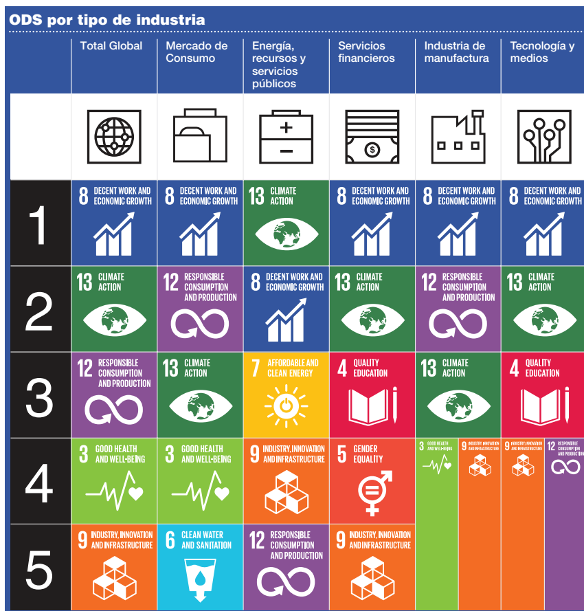
Figura N°1 ODS por tipo de Industria